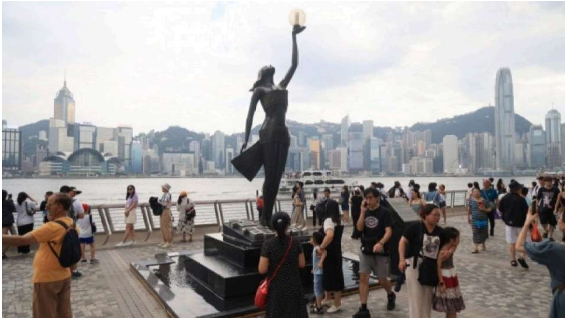
筆者認為要振興香港經濟應選擇做長遠而有效益的實事。資料圖片